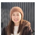
(2/21～23 滞在 女性)

担当者がとても丁寧で親切でした。又、希望の見学地に行くことが出来て、とても満足度の高いプログラムでした。企業の方や移住された方と話が出来て良かったです。自然豊かで、住民の方もやさしく、また来てみたいと感じる町でした。3日目に見学させて頂いた仙美里地区の公営住宅の建物、景観が気に入りました。