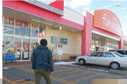
・町内案内(スーパー見学) (足寄町)