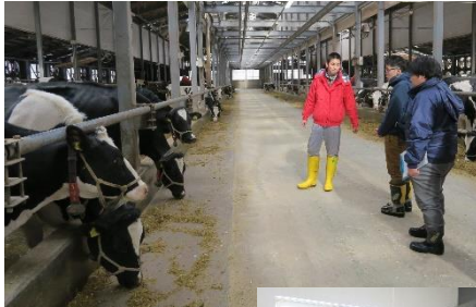
・酪農場見学 (陸別町)